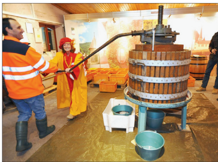
PRESSOIR Celui-ci fonctionne à l'huile de coude.

Comment mieux découvrir quelque chose qu'en y prenant part? Les visiteurs de l'exploitation le désirent se sont essayés à l'utilisation du pressoir. Et il était également possible, jeudi dernier, de participer à la